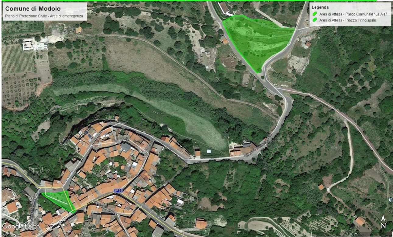
Fig.2 – Parco Comunale "Le Aie" (in verde) – Ritaglio Google Earth