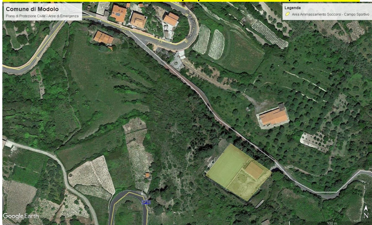
Fig.3 – Campo sportivo – Ritaglio Google Earth