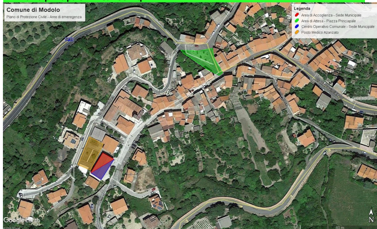
Fig.1 – Piazza Principale (in verde) – Ritaglio Google Earth